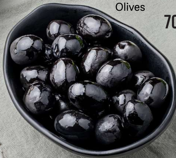
ԶԻԹԱՊՈՏՈՐ Оливки Olives 700