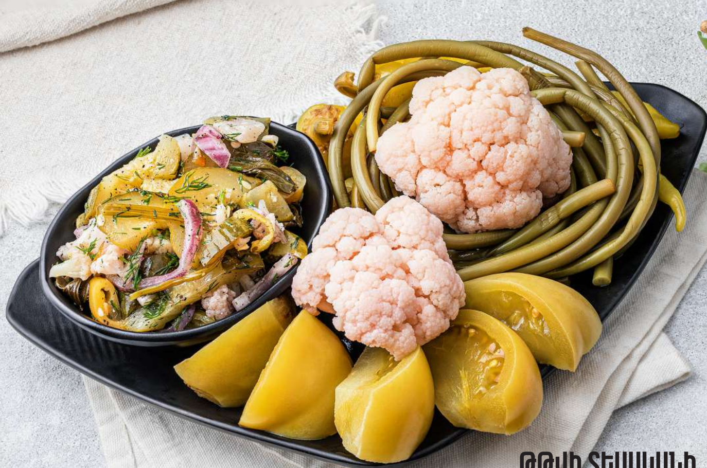
ԹԹՎԻ ՏԵՍԱԿԱՆԻ Ассорти солений Pickled assortment 1500