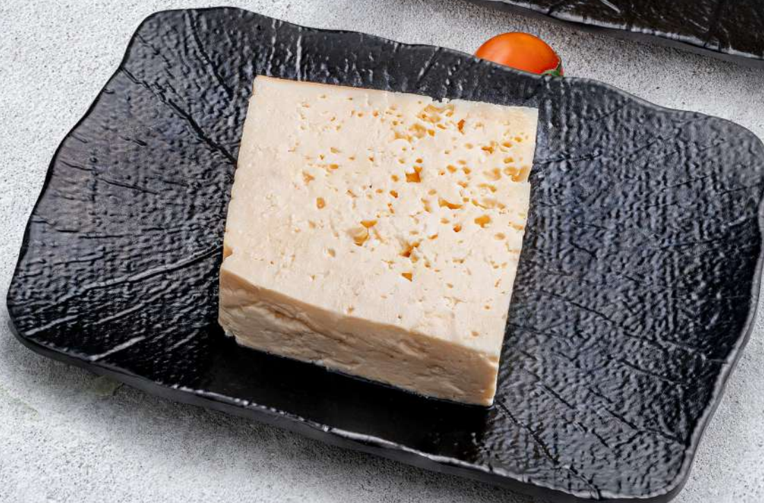
ՈՂԽԱՐԻ ՊԱՆԻՐ Овечий сыр Sheep cheese 1000