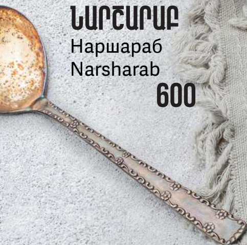
ՆԱՐՇԱՐԱԲ Наршараб Narsharab 600