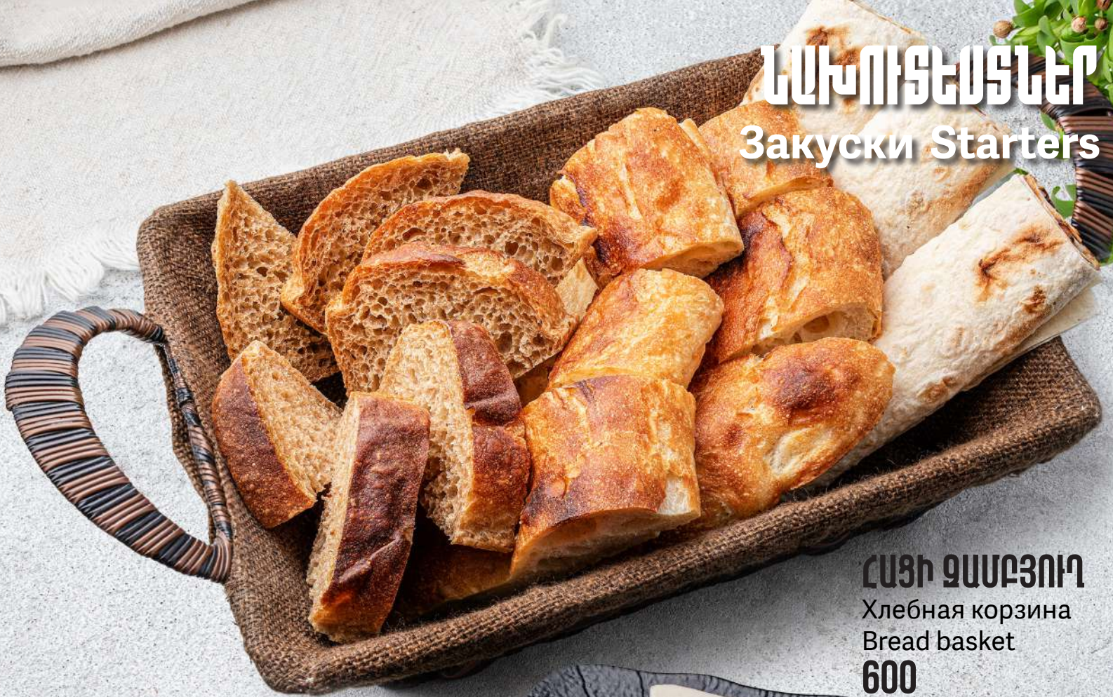
ՀԱՅԻ ԳԱՍԲՅՈՒՂ Хлебная корзина Bread basket 600