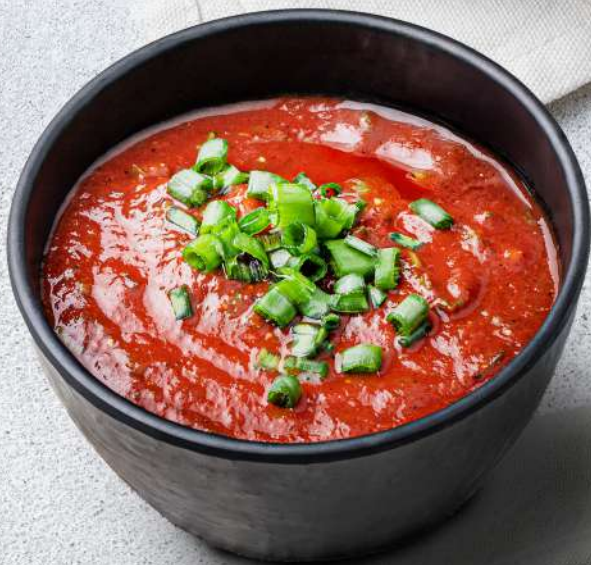
ԼՈԼԻՎԻ ՍՈՍԻՍ Томатный соус Tomato sauce 500