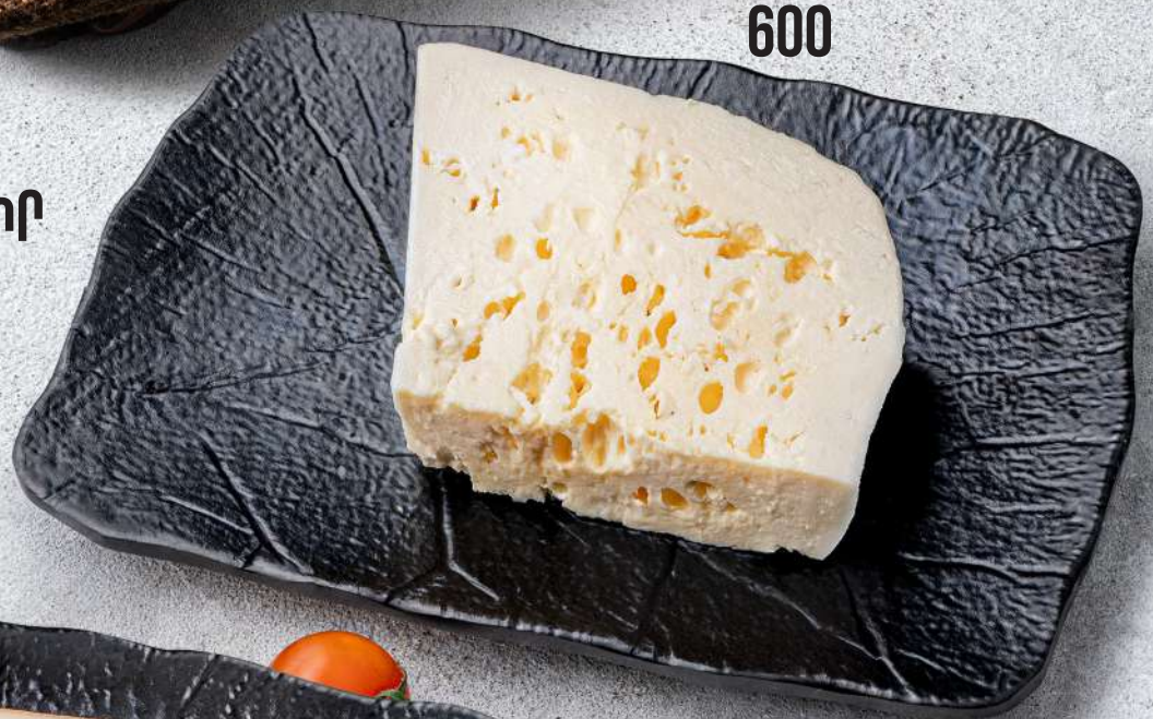
ՀԱՅԿԱԿԱՆ ՊԱՆԻՐ Армянский сыр Armenian cheese 1000